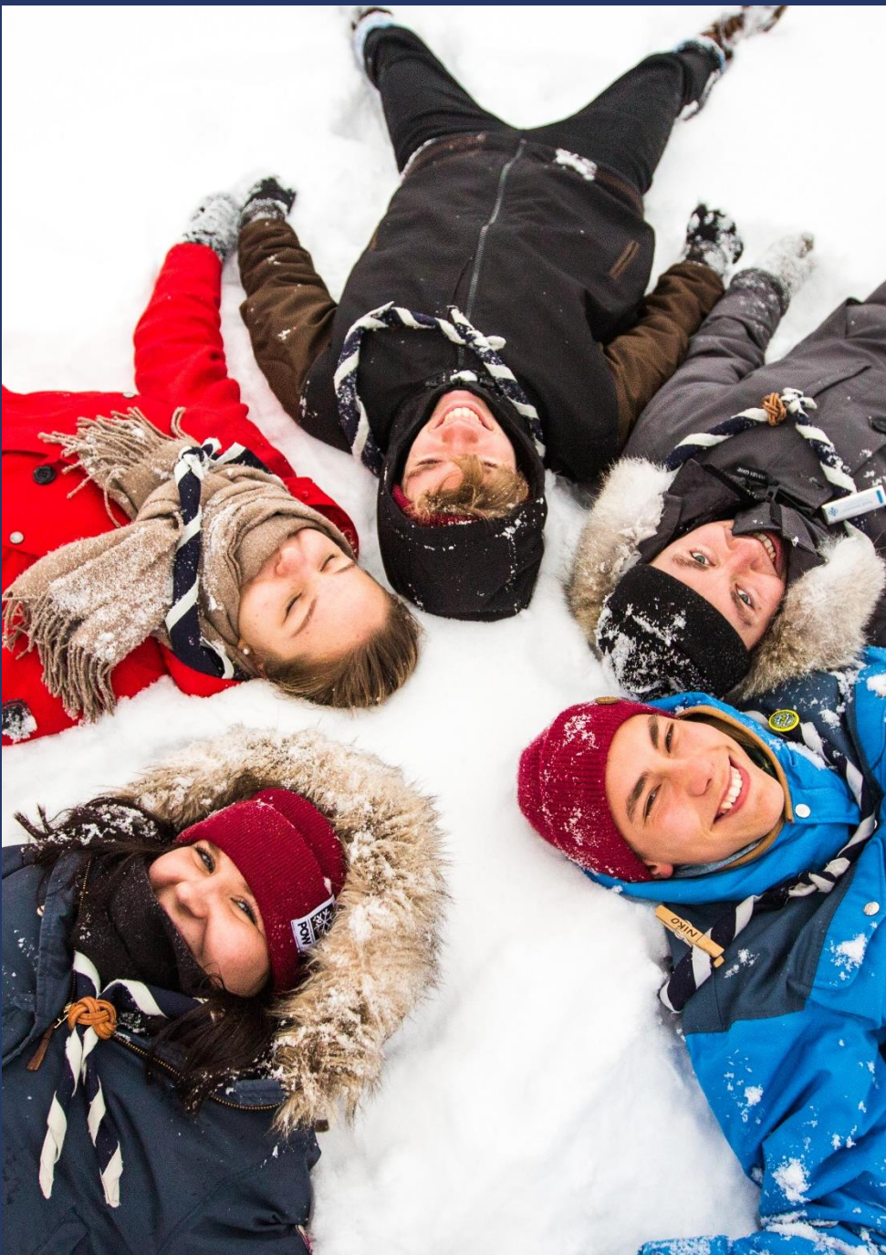
Kuva: Susanna Mikander